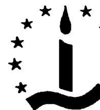
Tavola Valdese COMITATO PER I LUOGHI STORICI VALDESI

Luserna S.Giovanni, agosto 1993 Nuova edizione aggiornata: luglio 2005