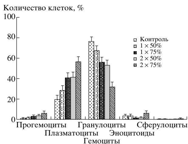
Рис. 2. Динамика гемограммы свободноживущих гусениц непарного шелкопряда, развивающихся на деревьях с различным уровнем объедания листьев; * – достоверные различия с контролем ( p < 0.05 ).

Как показали наши исследования, выраженность различий всех изученных показателей жизнеспособности непарного шелкопряда, развивающегося на интактных и поврежденных растениях, выше в насаждениях, где происходило естественное объедание древостоя насекомыми (таблица). Возможно, что определенное влияние на различия этих величин мог оказать характер дефолиации деревьев. Если в экспериментальных условиях дефолиация была равномерной по всей кроне и проводилась в течение 1–2 дней, то в естественных условиях насекомые сначала повреждали