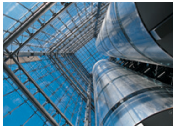
Здание просматривается насквозь: снизу вверх