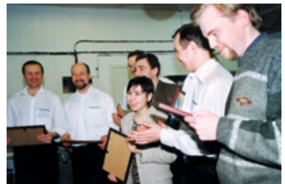
Гостеприимные хозяева тепло и радушно встречали гостей

чиналось все в 1996 году с огромного желания заниматься полиграфией маленького коллектива энтузиастов. Спустя три года коллектив типографии насчитывает 11 человек, а среди клиентов – большие предприятия