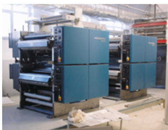
Монтаж печатной секции роллонной машины Mercury

Печатное оборудование, поставленное компанией Heidelberg в «Центр Печати Туркменистана», позволит выполнять тот