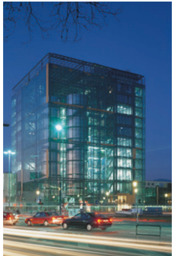
Здание Print Media Academy в городе Гейдельберг

Непрерывным условием успешной работы «Центра PMA Гейдельберг – МГУП», конечно же, должна стать обратная связь, постоянный контакт с сотрудниками типографий, причем самого разного уровня: от печатника до директора. Непосредственное общение позволит всегда делать обучение реальным, плодотворным, практичным, а не теоретизированным и отдаленным от реальной жизни.