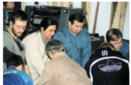
Монтаж оборудования. Рабочий момент

Мероприятие прошло очень торжественно и радушно. Было много гостей, клиентов, журна-