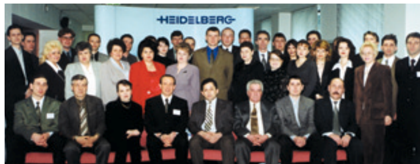
Гости и участники презентации в Иркутске