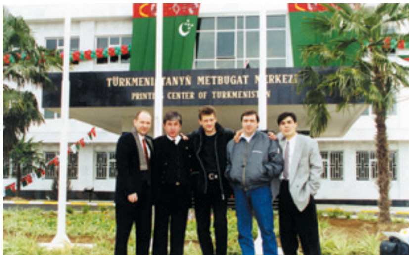
Сложная работа объединяет, а выполненное дело наполняет сердца радостью

чатной машины Mercury, спустя всего несколько минут она вышла на рабочую скорость — 45 тыс. отт./час и началась печать первой цветной газеты.