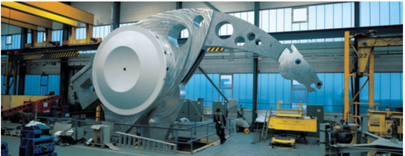
Уникальная лошадь на трех ногах стоит перед фасадом здания Print Media Academy. Ее дизайн столь же авангарден, как и дизайн самого строения