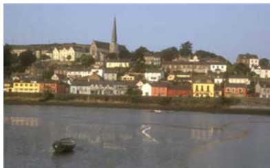
Crossshaven utenfor Cork, Irland

Til kvelden prøvde vi å gå inn til en ferjehavn, men den var helt ubrukelig i pålandsvær, så da det ellers var lite havner i området ble det å fortsette ut i havet forbi Carrick Rock i mørke og frisk bris, og det ble til at vi fortsatte helt til Crossshaven utenfor Cork i Irland i en leg. I Cork har de en god båtbutikk og folk var generelt særs oppmerksomme og trivelige (Som de sa, "..we are from Ireland".)