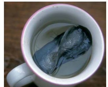
Hva er dette?

Vi ankom La Coruna i Spania midnatt (trodde vi) etter 4,5 døgn seilas og en gjennomsnittsfart på