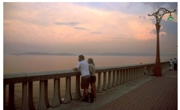
Kveldsstemming i La Coruna