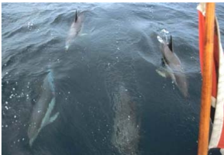
Mye å se både i sjø og luft