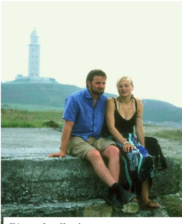
Skipperne foran Hercules.

Gamlebyen var en eneste stor restaurant med mye spennende sjømat der det kunne virke som om byens 250k befolkning var ute å spiste hver kveld/natt. Kanskje ikke så rart når man kunne få en 3 retters middag med drikke og kaffe for €8 (70 kr.). Men i lengden ble det noe anmassende å vandre rundt i mellom border og matlukt overalt.