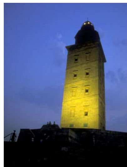
Det 1800 år gamle Romerske fyret Hercules i La Coruna – Galicia, plassert der Hercules etter sagnet hogg hodet av sin fiende.