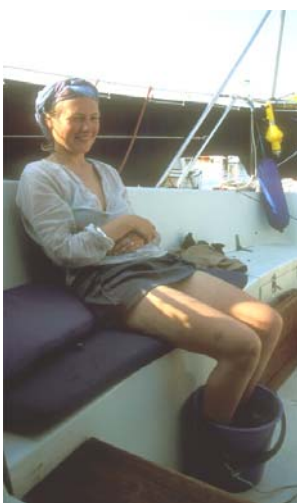
Lena er varm

Til kvelden prøvde vi å gå inn til en ferjehavn, men den var helt ubrukelig i pålandsvær, så da det ellers var lite havner i området ble det å fortsette ut i havet forbi Carrick Rock i mørke og frisk bris, og det ble til at vi fortsatte helt til Crossshaven utenfor Cork i Irland i en leg. I Cork har de en god båtbutikk og folk var generelt særs oppmerksomme og trivelige (Som de sa, "..we are from Ireland".)