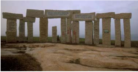
La Corunas svar på Stonehenge

Gamlebyen var en eneste stor restaurant med mye spennende sjømat der det kunne virke som om byens 250k befolkning var ute å spiste hver kveld/natt. Kanskje ikke så rart når man kunne få en 3 retters middag med drikke og kaffe for €8 (70 kr.). Men i lengden ble det noe anmassende å vandre rundt i mellom border og matlukt overalt.